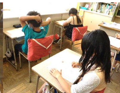
出題範囲は前学年で学習した内容

CRT……絶対評価法（個人の到達度）による検査。年間の指導目標に対する理解の状況を確認する。本校では二者面談で検査結果を示して、その後の指導に役立てます。良い、悪いで一喜一憂するのではなく、課題を見つけ次に生かすことが大切です。