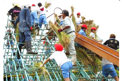
上：和太鼓活動部会 太鼓搬出入

赤井5（和太鼓活動、俊斎学習、田んぼの学校、SDGs活動、たてわり活動）を講師やボランティアとなって支えています。昨年はいぶき太鼓の修繕費用の寄付活動ではPTAと協働で取組み、学校のピンチを救っていただきました。 「地域の子供は地域で育てる応援団」