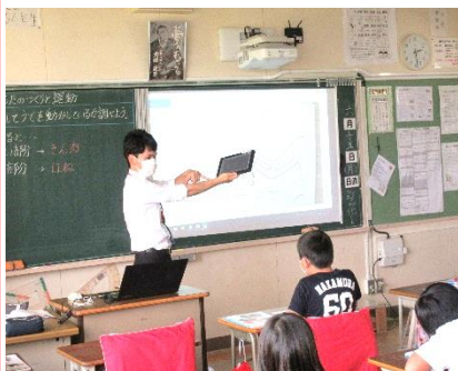
学校訪問【4年生 骨・筋肉の作り】

臨時休業のよりできなかったCRTを2年生以上で実施しました。今年度6年生対象の全国学力・学習状況調査が無くなったため、 学習の理解度を把握する客観的資料になります。 子供たちは真剣に問題を読み、回答用紙に向かっていました。