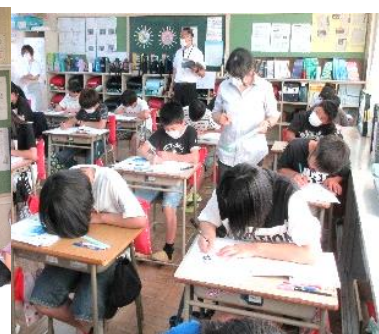
【6年生 投稿文の構成】