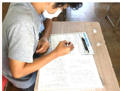
CRT：集中して取り組む学びの姿