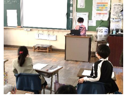
できること発表会「タイピング」(1年生)

懇談会前の学校説明会で今年度の取組と来年度の学校経営の方針について述べるできませんでしたので本紙でお伝えします。