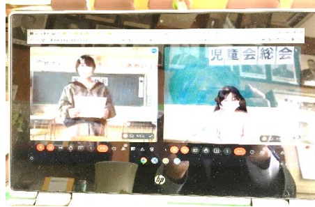
回答者(6年)と質問者(2年)