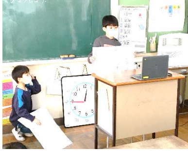
1年間の成長絵巻(2年生)