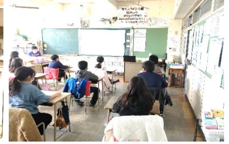
総会資料を見ながら教室で参加

2月17日(木)に今年度の児童会活動を振り返る「後期児童会総会」がリモートで開催されました。感染予防強化期間として、2つ以上の学年が一緒にならるように、会場は3つです。1つ目の会場では各委員会の委員長が1年間の活動の報告し、2つ目の会場には4年生以下の代表者が立ち替わり入って委員会へ質問やお願いをしました。3つ目の会場は各教室です。質問者以外の子供たちは教室のスクリーンを見て参加しました。