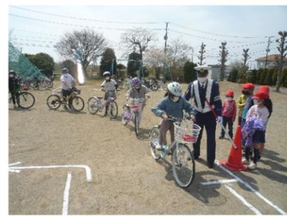
【4月21日 交通安全教室】

安全な道路の歩き方や自転車の 乗り方について、交通指導態 の方々に教えていただきました。